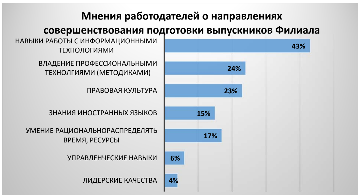
Рисунок 8. Умения и навыки выпускников Филиала, которые нуждаются в совершенствовании по мнению работодателей (в %)

Рисунок 8 отображает распределение ответов работодателей на вопрос о том, какие умения и навыки выпускников Филиала нуждаются в совершенствовании. 43% работодателей считают, что необходимо повышать уровень владения информационными технологиями студентов Филиала. 23% опрошенных подчеркнули важность формирования правовой культуры. 24% респондентов отметили необходимость повышения уровня владения профессиональными методиками и технологиями. Менее 20% респондентов считают необходимым совершенствовать уровень владения иностранными языками, рациональнее распределять время и ресурсы, развивать управленческие навыки и лидерские качества.