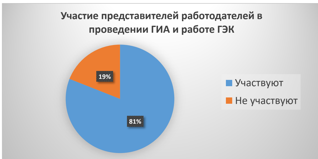
Рисунок 1. Участие представителей работодателей в проведении государственной итоговой аттестации выпускников Филиала и работе государственных экзаменационных комиссий (в %)

В анкетировании, которое было проведено в ноябре 2022 года, принимали участие работодатели и их представители, участвующие в реализации образовательных программ в 2021-2022 учебном году в Филиале. Анкеты заполнили 24 респондента.