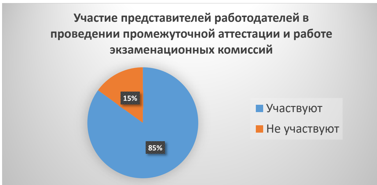
Рисунок 2. Участие представителей работодателей в проведении промежуточной аттестации и работе экзаменационных комиссий по проведению квалификационных экзаменов (в %)

Респондентам был задан вопрос: «Участвуют ли представители вашей организации в проведении государственной итоговой аттестации выпускников Филиала и в работе государственных экзаменационных комиссий?». Распределение ответов представлено на рисунке 1. Три четверти опрошенных ответили на него утвердительно. Соответственно, 19% опрошенных не участвуют в мероприятиях государственной итоговой аттестации.