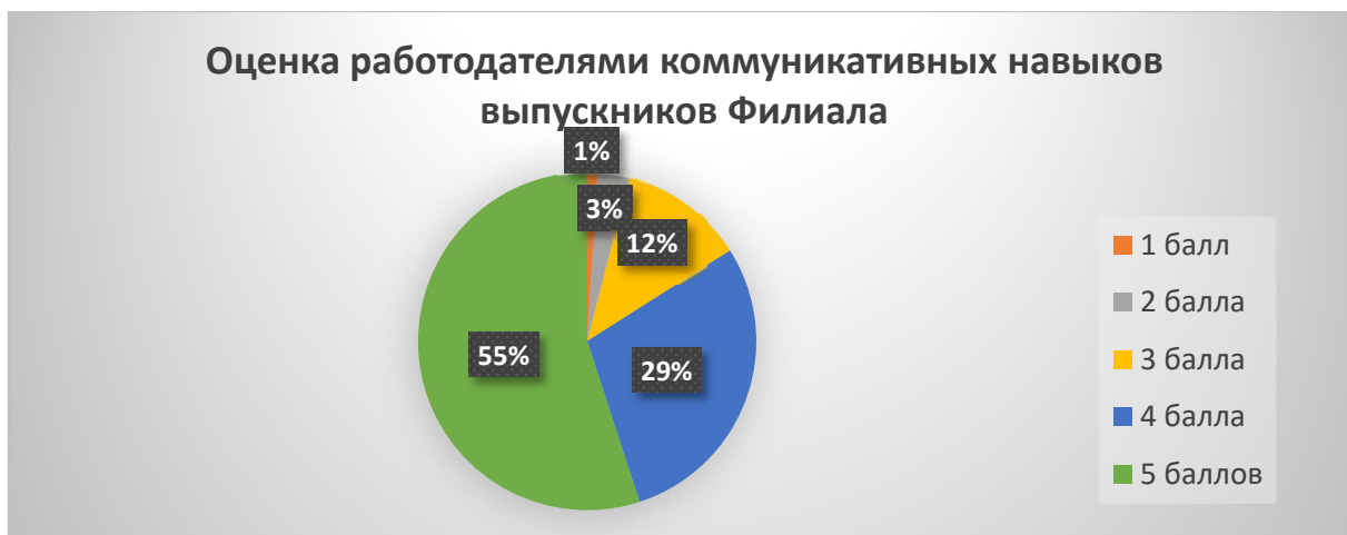
Рисунок 6. Оценка работодателями по пятибалльной шкале уровня коммуникативных навыков выпускников Филиала (в %)

На рисунке 5 представлены результаты ответа респондентов на вопрос об оценке уровня практических умений и навыков выпускников Филиала. На уровне 5 баллов практические умения и навыки оценивают 50 % респондентов, оценку 4 балла поставили 28% опрошенных. Удовлетворенность работодателей уровнем практических умений и навыков выпускников Филиала составляет 78 %.