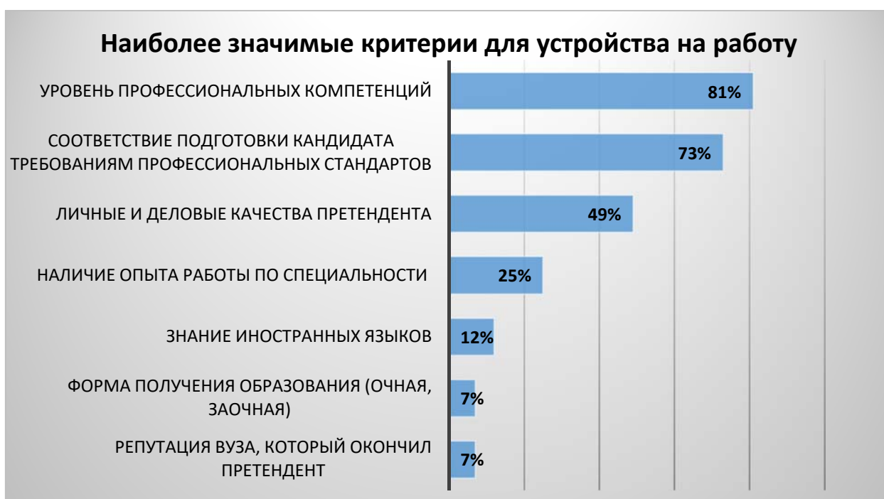
Рисунок 9. Наиболее значимые критерии для устройства на работу, по мнению работодателей (в %)

Рисунок 8 отображает распределение ответов работодателей на вопрос о том, какие умения и навыки выпускников Филиала нуждаются в совершенствовании. 43% работодателей считают, что необходимо повышать уровень владения информационными технологиями студентов Филиала. 23% опрошенных подчеркнули важность формирования правовой культуры. 24% респондентов отметили необходимость повышения уровня владения профессиональными методиками и технологиями. Менее 20% респондентов считают необходимым совершенствовать уровень владения иностранными языками, рациональнее распределять время и ресурсы, развивать управленческие навыки и лидерские качества.