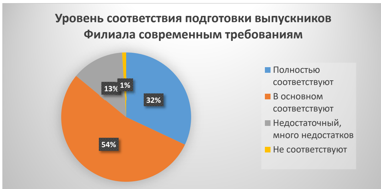
Рисунок 10. Ответы респондентов об уровне соответствия подготовки выпускников Филиала современным требованиям (в %)

Ни рисунке 9 представлены распределения ответов участников опроса о критериях, которые важны для работодателей при отборе претендентов на вакантные места. 81 % респондентов отметили важность профессиональных компетенций. 73 % опрошенных выделили соответствие подготовки кандидата требованиям профессиональных стандартов. Для половины участников опроса значимы личные и деловые качества претендентов. 25 % респондентов считает важным наличие опыта работы по специальности. Ниже по значимости знание иностранных языков – 12%. Совсем не важны для трудоустройства - форма получения образования (очная, заочная) и престиж вуза, который окончил выпускник.