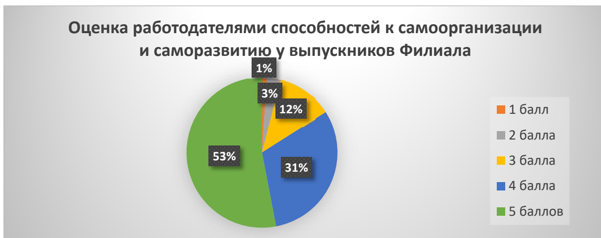
Рисунок 7. Оценка работодателями по пятибалльной шкале навыков выпускников Филиала к самоорганизации и саморазвитию (в %)

Рисунок 6 отображает распределения ответов участников опроса об оценке формирования в Филиале коммуникативных навыков выпускников. 55% опрошенных оценивают коммуникативные навыки выпускников Филиала на уровне 5 баллов, а 29% респондентов дали оценку на уровне 4 баллов. 84 % респондентов удовлетворены развитием коммуникативных навыков выпускников Филиала.